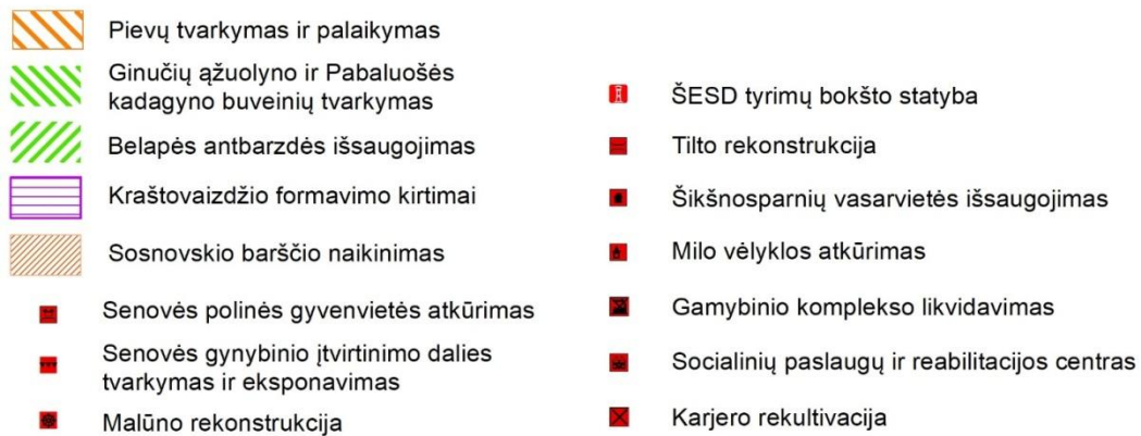
2 pav. Tvarkymo plano brėžinio 2 lapo iškarpa.