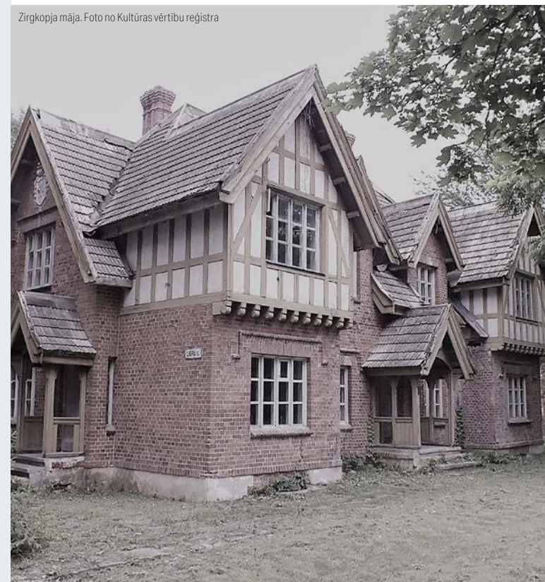
Zirgkopja māja.